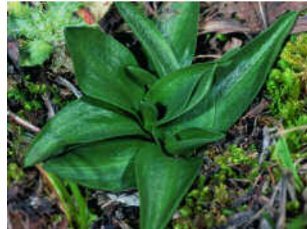
Bild-Dokumentation von Lebenszyklen Austrieben, Früchten, Winterrosetten und typischen Biotopen.